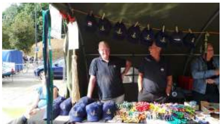
De Toko-bemanning: klaar voor de "handel"!