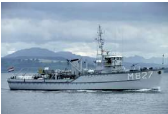
De Hoogeveen met gesloten brug in begin jaren 90.

De Hoogeveen wordt in 1973 vervroegd in het FRAM ingepast, vanwege de toestand van de huid van het schip. Extra reparaties aan het bakdek, de voorsteven en de huid, laten het werk dan ook minder snel verlopen dan gepland. Het FRAM project houdt een ombouw in van de 14 schepen van de Dokkumklasse. De schepen krijgen een gesloten stuurhuis. De accommodatie wordt verbeterd en de slechte huiddelen worden vervangen en aan de duikvaartuigen wordt extra accommodatie gemaakt voor hun rol als hoofdkwartierschip tijdens veegoperaties.