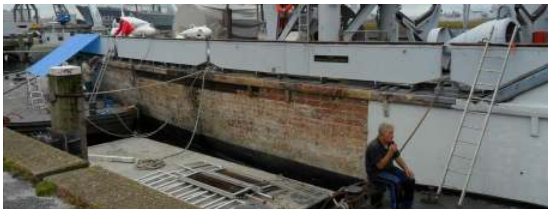
Een kaal stuurboord vrijboord. (werkweek september)