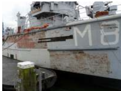
Een "kale" Hoogeveen