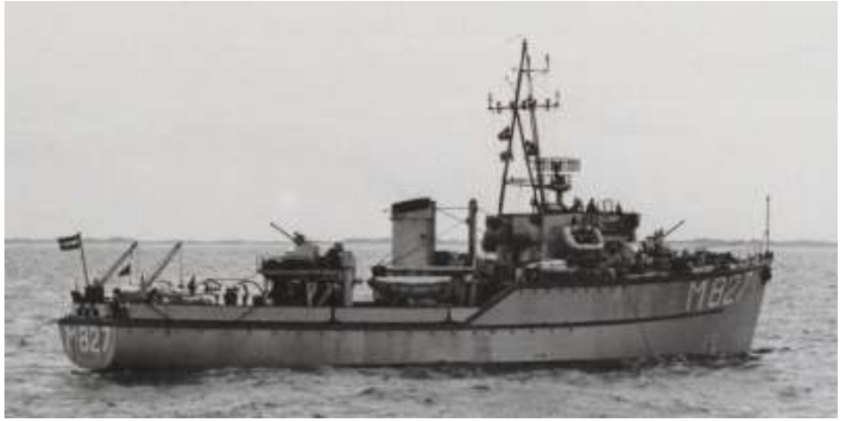
De Hoogeveen met oude vormgeving van de boegnummers.

De schepen zijn genoemd naar kleinere gemeenten in Nederland,