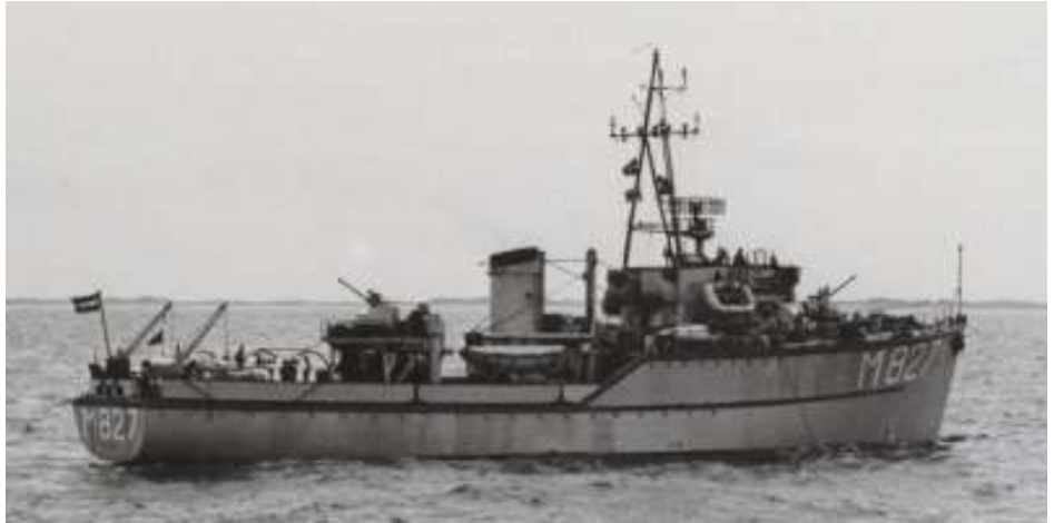
De Hoogeveen met oude vormgeving van de boegnummers.

De schepen zijn genoemd naar kleinere gemeenten in Nederland,