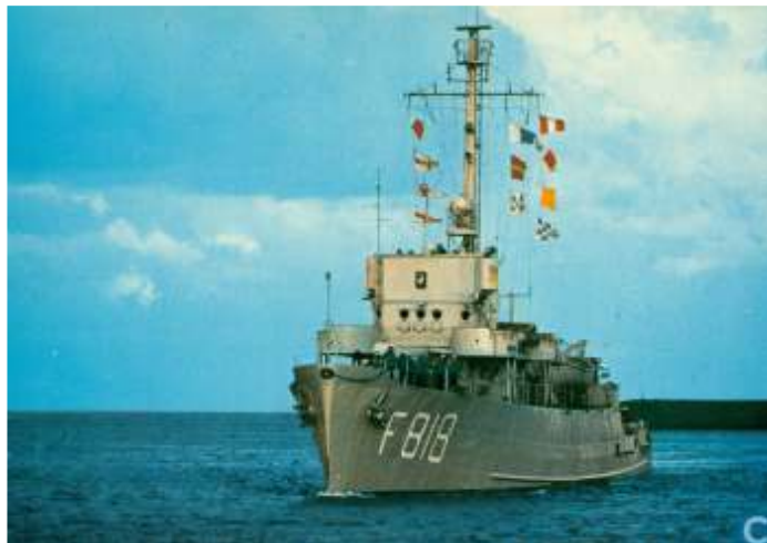
Hr Ms Fret.