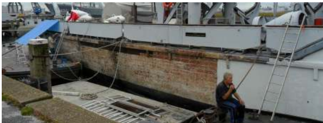
Een kaal stuurboord vrijboord. (werkweek september)