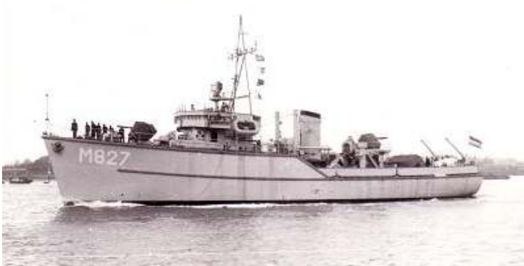
Hr. Ms. Hoogeveen toen nog met open stuurhuis.

Nederlanden. In 1964 wordt de Hoogeveen opnieuw uit dienst gesteld. ➔