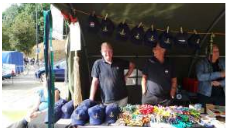
De Toko-bemanning: klaar voor de "handel"!