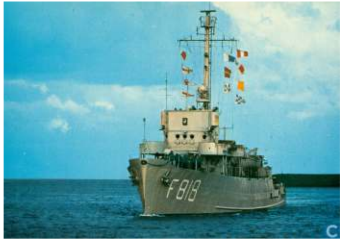
Hr Ms Fret.