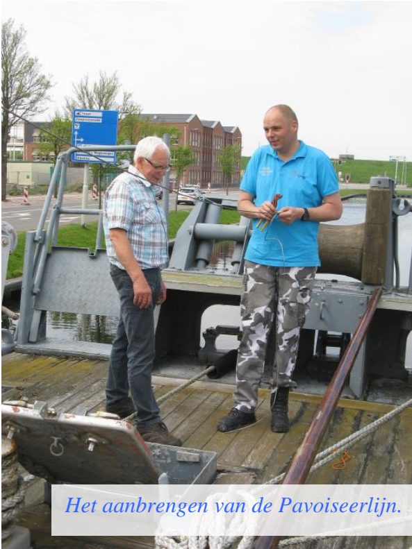
Het aanbrengen van de Pavoiseerlijn.

werd gedaan om straks gepavoiseerd te liggen tijdens Sail Den Helder en veteranen- en Marinedagen.