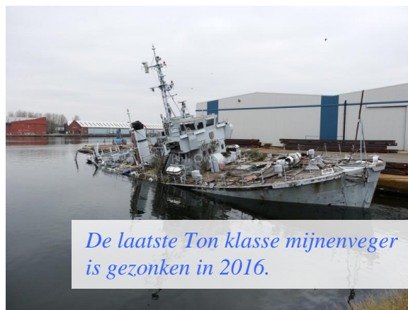
De laatste Ton klasse mijnenveger is gezonken in 2016.