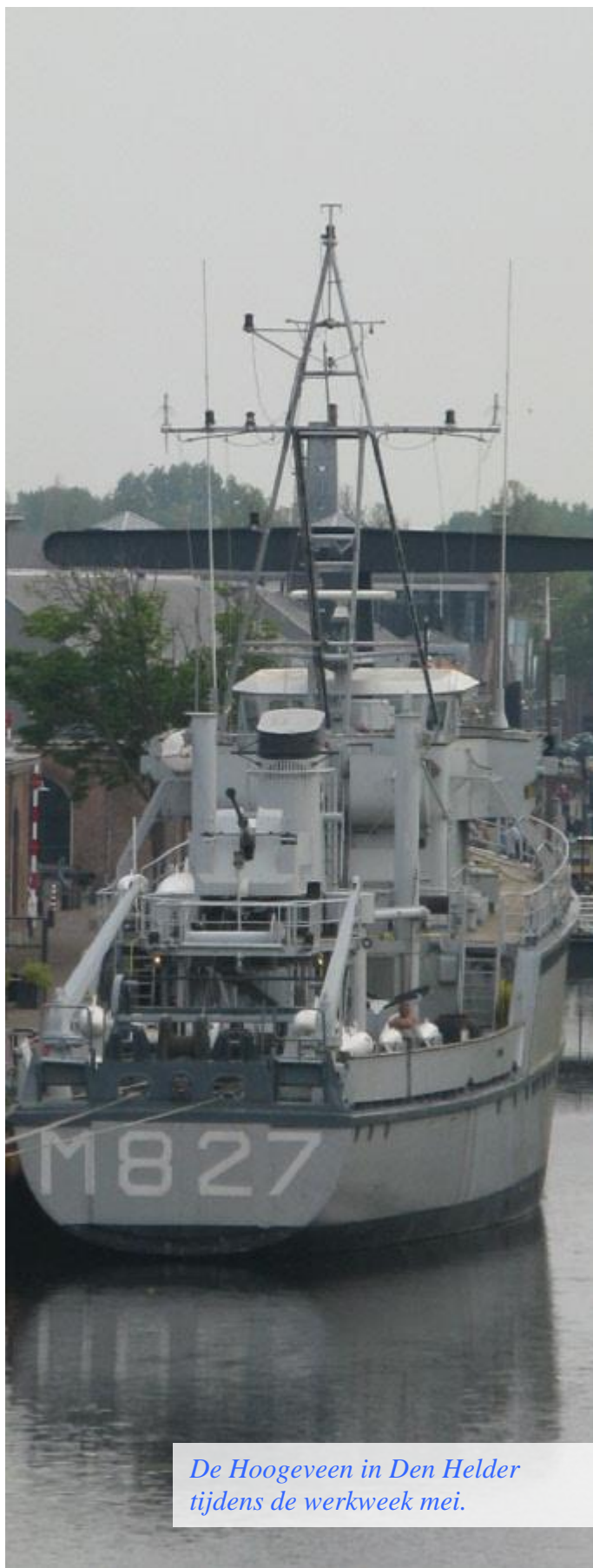
De Hoogeveen in Den Helder tijdens de werkweek mei.